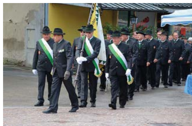
Abordnung beim Jahresfest

Am 06. September fand unser traditionelles Jahresfest statt. Nach einer Heiligen Messe zu Gunsten unserer gefallenen Kameraden marschierten wir gemeinsam mit der Feuerwehrkapelle Fernitz zum Kriegerdenkmal um einen Kranz niederzulegen. Zeitgleich mit dem Sterzsonntag fand am Kirchplatz dann auch der Ausklang statt.