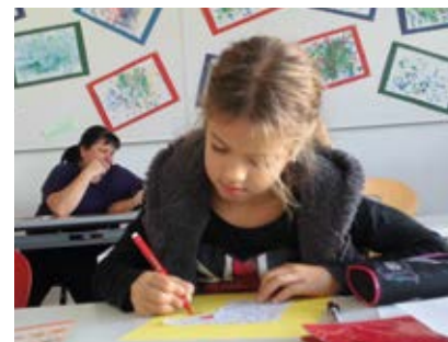
Avenida – Gedichte schreiben