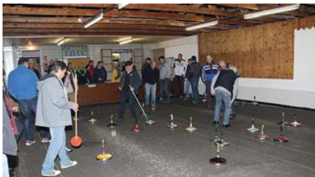
Beim Knödelschießen gegen ÖKB Mellach

Voller Einsatz kämpften die beiden Vereine um den Titel. Leider konnten unsere Damen und Herren auch diesmal den Sieg nicht mit nach Hause nehmen. Dies war für unsere Kameraden aber kein Grund sich den Knödel nicht schmecken zu lassen.