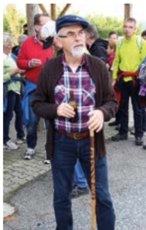
Gestärkt für den weiten Weg!

Der ÖKB freut sich sehr über die immer steigende Beliebtheit dieser Veranstaltung!