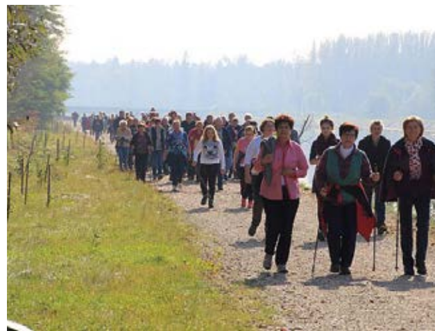
Auf Schusters Rappen am Staatsfeiertag

Traditionell zum Staatsfeiertag begingen wir unseren Familienwandertag. Dieses Jahr führte die Route entlang der Mur Richtung Gössendorf. Auf zwei Labestationen entlang der Route wurden unsere Wanderer mit Eierspeis und Getränken versorgt. Ziel war schließlich das VAZ in Fernitz. Auch dieses Jahr hatten wir Glück mit dem schönen Wetter und konnten den Familienwandertag in geselliger Runde mit einem Grillfest ausklingen lassen. Zum Abschluss fand eine Verlosung mit schönen Sachpreise statt.