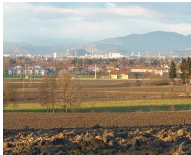
Weiterbauen oder weiterackern?

Die Raumplanung ist (auch in Fernitz-Mellach) gefordert, bei der Erstellung des neuen Flächenwidmungsplanes auf diese Situation zu reagieren. Der Zersiedelungsgrad ist in unserer Gemeinde bereits sehr hoch, auf der anderen Seite bleibt aber auch der Siedlungsdruck aufrecht. Die Abt. 13 der Stmk. Landesregierung spricht in diesem Zusammenhang von „grüner und blauer Infrastruktur“. Damit sind Grünflächen und Wasserflächen im Siedlungsraum gemeint, die zur klimatischen Entlastung beitragen; z.B. die Verhinderung von Überschwemmungen durch Verbleib von Wasserrückhalteflächen oder die Ausbildung von kühlenden Zonen (Schattenbäume). Diese Flächen haben auch wertvolle ökologische Funktionen als Lebensräume und Wanderstrecken für Tier- und Pflanzenarten.