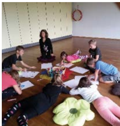
Polarisation der Aufmerksamkeit durch eine „Stilleübung“

Weiters wollen wir uns in diesem Jahr auch näher mit dem Thema „Lernen-lernen“ befassen und den Kindern viele kreative und lustige Lernspiele und Konzentrationsübungen anbieten, durch die sie „spielend lernen“ und dadurch sowohl in ihren kognitiven Fähigkeiten, als auch in ihrer Selbst-, Sach- und Sozialkompetenz gefördert werden.