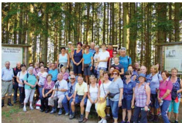
Gruppenfoto am Hoamatweg

Mario Krisper, Schriftführer