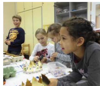
Arbeiten mit sogenannten „wertlosen Materialien“

Viele berühmte Persönlichkeiten, waren sich der Bedeutung des Spieles für den Menschen bewusst. Einige möchten wir hier zitieren: