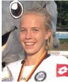
Als beste Spielerin im internationalen STEKA Cup 2015 in Rheinland-Pfalz ausgezeichnet.

Aufgrund einer Knieverletzung konnte ich anfangs nicht voll mittrainieren. Mittlerweile ist mein Knie voll